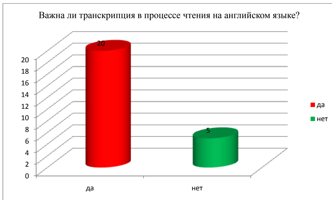
Диаграмма № 1

Большинство детей дали положительный ответ. Небольшая часть опрошенных не придают большого значения фонетической стороне слов. Следует отметить тот факт, что та группа детей, которые не уделяют нужного внимания транскрипции, допускают серьезные ошибки при чтении. Поэтому мы не только рекомендуем, а даже настаиваем проводить глубокий анализ слова. Тем более, что транскрипция дает нам возможность не только проверить или узнать точное произношение слова, но и определить ударение в слове.