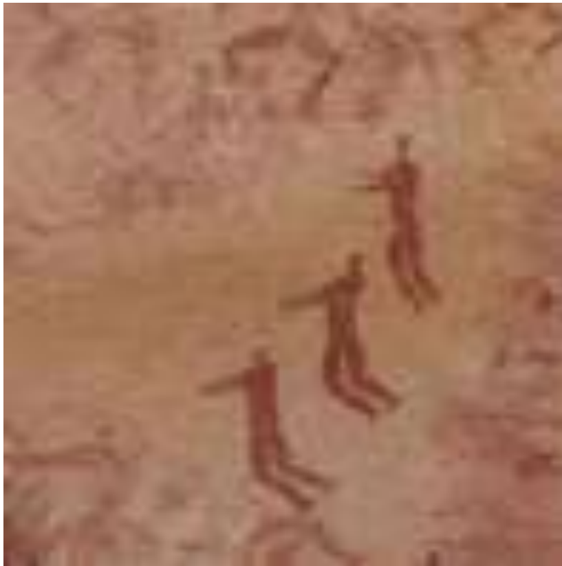
Изображение летевших инопланетян

На древнейших рисунках и гравюрах движение выражают положение ног, наклон тела или поворот головы. Неподвижных фигур почти нет. Нехитрые контуры со скрещивающимися ногами дают нам пример такого движения.