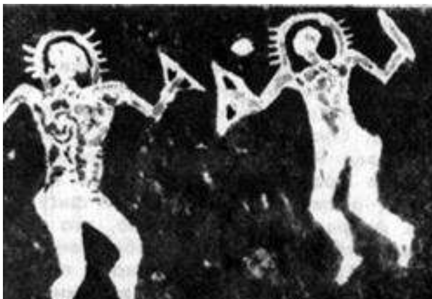
«Воины из Камоники»